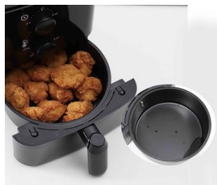
サクサク&ヘルシー