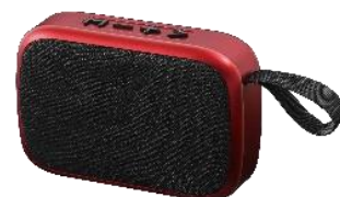
メタリックレッド