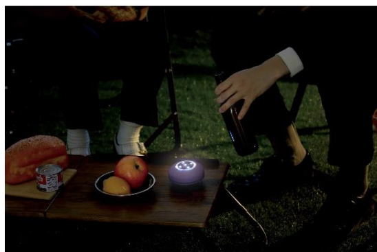
アウトドアなど屋外でも