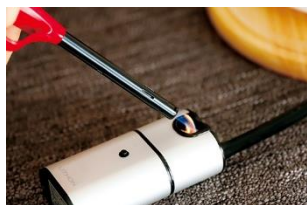
お家で手軽に燻製料理