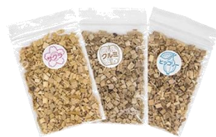
3種類のスモークチップ付き