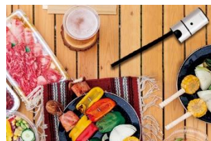
アウトドアでも大活躍