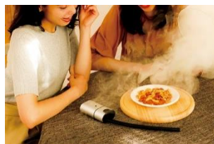
ホームパーティーの演出に